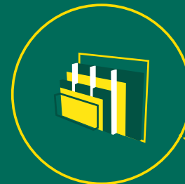
celostenovými sendvičovými panelmi na báze dreva